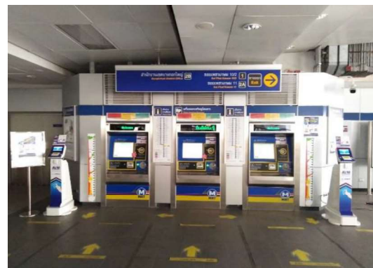
รูปที่ 1-2 สภาพการดำเนินการโครงการในช่วงเดือนมกราคม-มิถุนายน 2565